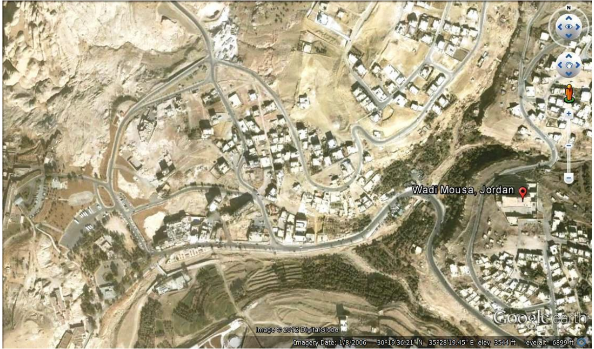
صورة تبين المنطقة السياحية التي تشمل الشارع السياحي ومدخل المحمية والوادي