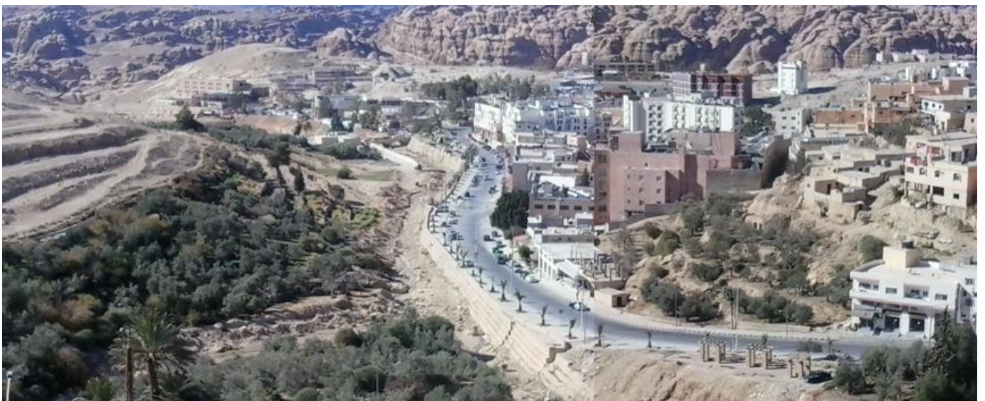
صورة (١) تبين منطقة مشروع تطوير وتنسيق الموقع للمنطقة السياحية في وادي موسى