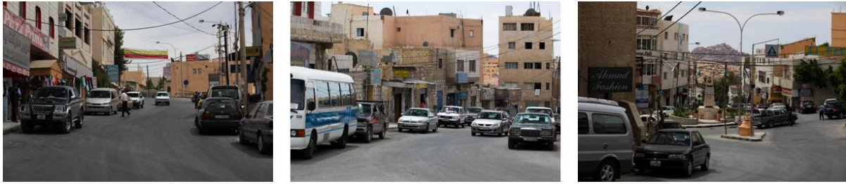
الشكل (١) : لقطات للمنطقة المستهدفة تعبر عن بعض جوانب التحديات والاشكاليات (التلوث البصري، الازدحام، وضياح الشخصية التراثية...الخ)

ويبين الشكل التالي رقم (١) بعض اللقطات التي تعبر عن بعض جوانب التحديات والاشكاليات