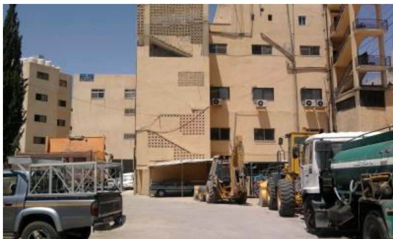
الشكل (٤) : المباني الموجودة ضمن حدود منطقة الخدمات