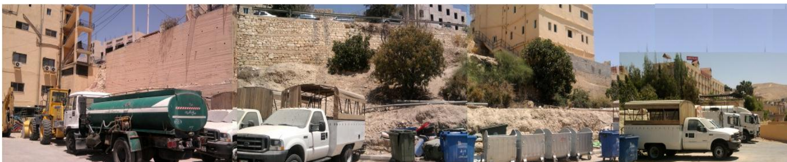
الشكل (٣) : فرق المنسوب ما بين ساحة الخدمات والشارع العلوي