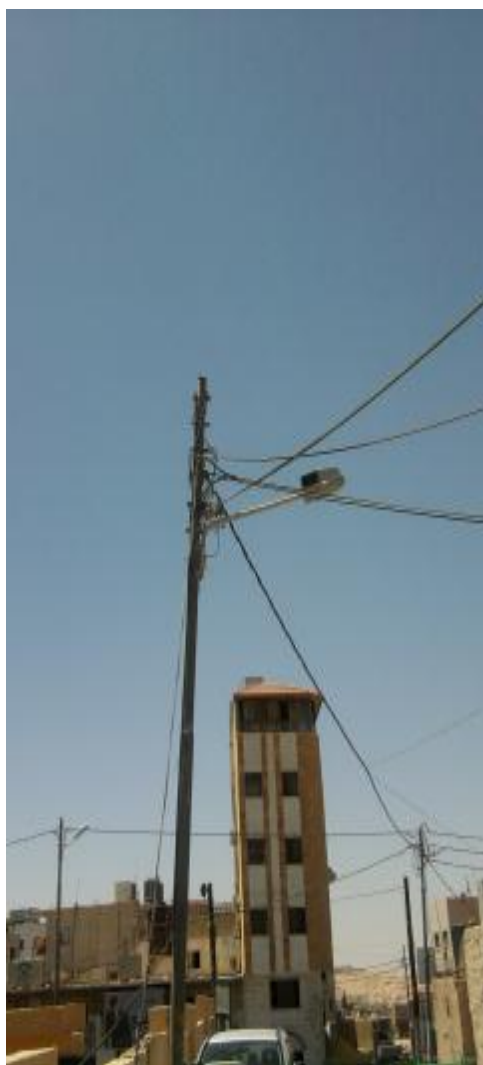
الشكل (٦): التلوث البصري