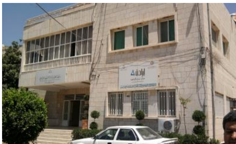
الشكل (٥) : مبنى الخدمات التابع لسلطة إقليم البتراء التنموي السياحي