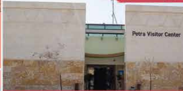
مركز الزوار هو نقطة البداية للتحول إلى مدينة البتراء القديمة، يمكنك من هنا أن تشتهي الذكريات وتحل المشكليات وتحصل على المعلومات عن زيارة الموقع.