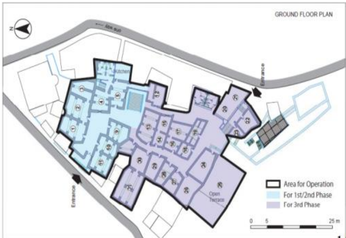
الصورة توضح موقع القرية والتقسيمات الداخلية بها